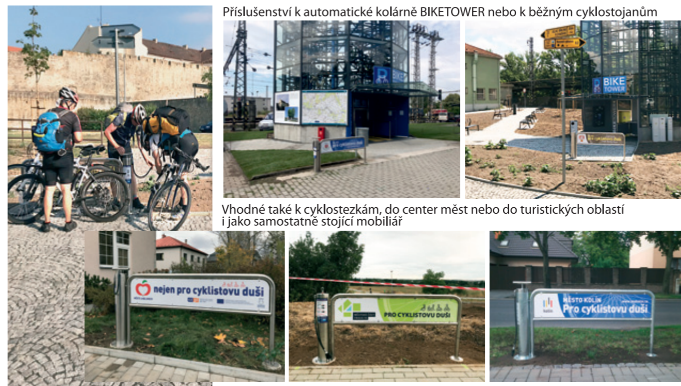
Příslušenství k automatické kolárně BIKETOWER nebo k běžným cyklostojanům

Jednoduché mechanické zařízení pro dohuštění pneumatik nejen jízdních kol