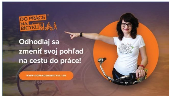
Obr.5: Kampaň Do práce na bicykli na Slovensku, zdroj: https://www.dopracenabicykli.eu/dokumenty-na-stiahnutie

Na Slovensku probíhá celonárodní kampaň „Do práce na bycykli“ od 1. března do 31. května 2018. Pátý ročník soutěže vyhlašuje Ministerstvo dopravy a výstavby SR ve spolupráci s Občanskou cykloiniciativou Banská Bystrica. Hlavním cílem je pod mottem „Odhodlaj sa zmeniť svoj pohľad na cestu do práce!“ podpořit rozvoj nemotorové, především cyklistické dopravy ve městech. Národní kampaň se snaží vyzvat samosprávy na Slovensku a zaměstnavatele k vytváření kvalitních podmínek pro cyklistickou dopravu a motivovat zaměstnance k většímu využívání této dopravy při cestě do práce.