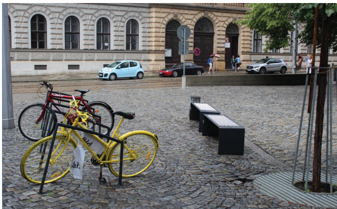
Obr.4: Městské prostředí přivítivé všem uživatelům, autor: Michal Bajgart

Evropská komise vyhlásila tři finalisty soutěže Evropského týdne mobility: Prahu, Vídeň a Granadu. Celkový vítěz bude oznámen na slavnostním vyhlášení 21. března v Bruselu.