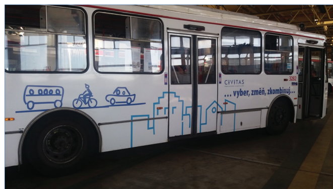
Obr.1: Trolejbus MHD v Brně s upoutávkou na CIVITAS