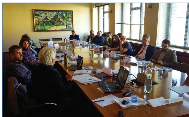
Obr. 3: Diskuze nad způsoby, jak nadchnout pro participaci i „tichou většinu“

Po krátké přestávce program již pokračoval workshopem, který spočíval v čtyřskupinové identifikaci stakeholderů v procesu tvorby Plánů udržitelné městské mobility, jejich moci (významu) v procesu, a míry, do jaké je Plán zasahuje. I když princip byl jednoduchý, diskuze nad různorodým přisuzováním významu a dopadů mezi skupinami vedly k postřehům nad možnostmi uvažování o plánech, procesu jejich tvorby a implementace. Na závěr Patrick přislíbil, že výstupy z něj budou základem pro další aktivity v rámci navazujícího červnového programu.