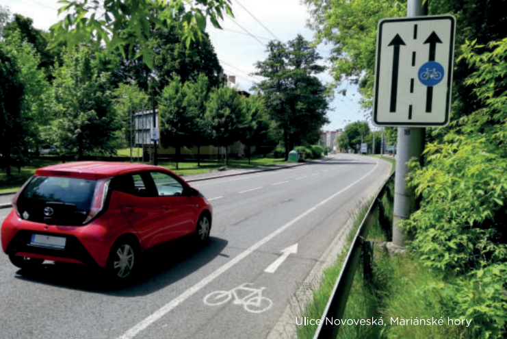
Ulice Novoveská, Mariánské hoří