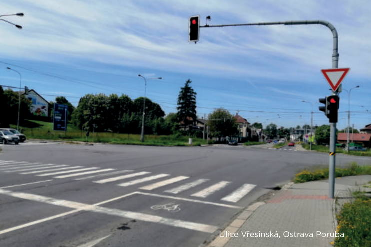
Ulice Vřesinská, Ostrava Poruba