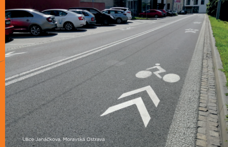
Ulice Janáčkova, Moravská Ostrava