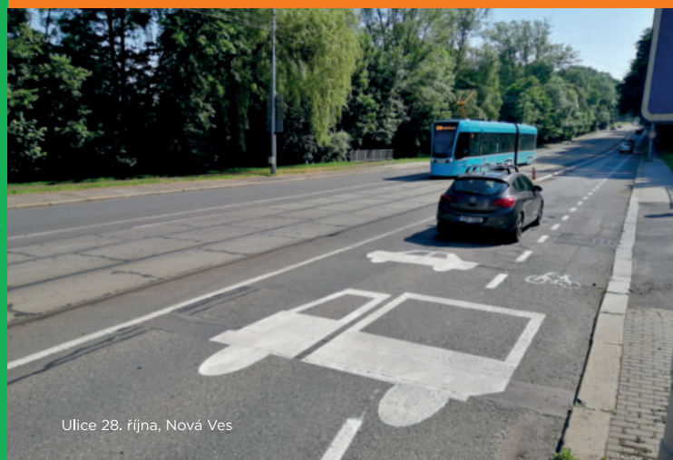
Ulice 28. října, Nová Ves