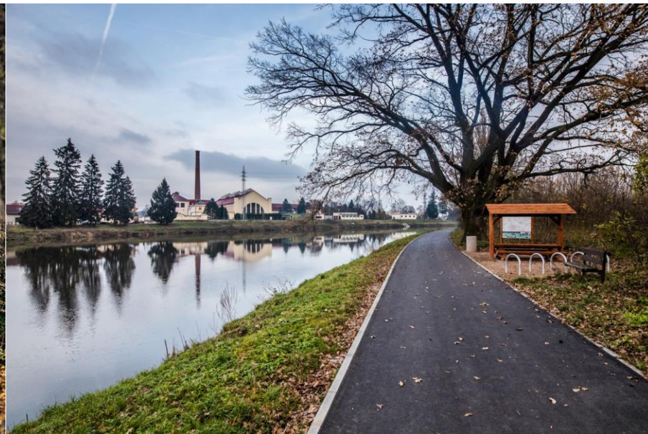
CZ.06.1.37/0.0/0.0/15_016/0000764 Labská cyklostezka, úsek Čelákovice - Lázně Toušeň