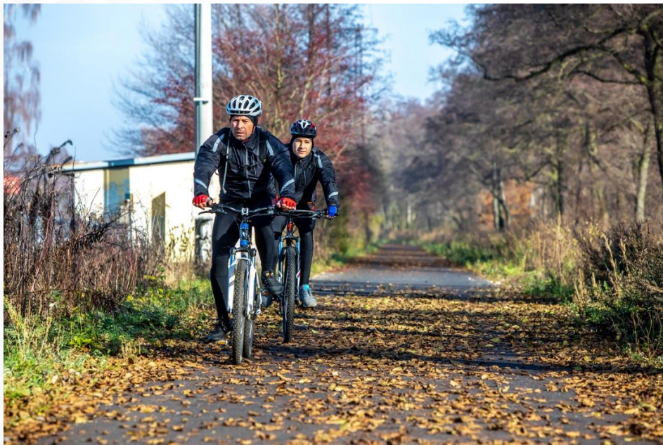
CZ.06.1.37/0.0/0.0/16_046/0007302 Cyklostezka Ohře, úsek Doubský most - Dvorský most